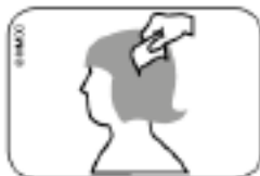
Abb. Durchkämmen des nassen Haares mit Läusekamm vom Haaransatz bis zu den Haarspitzen